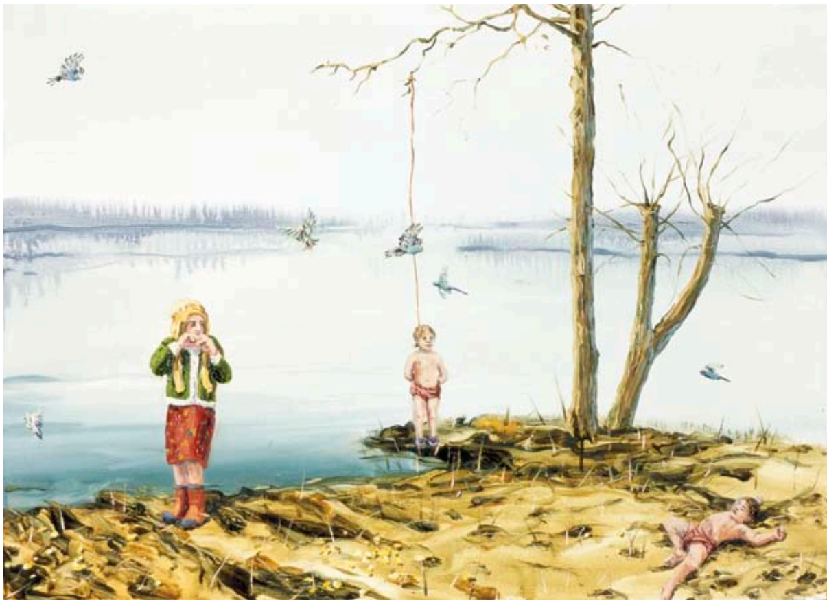
HÄNGANDE BARN OCH FÅGELSÅNG | HANGING CHILD AND BIRD SONG, 2007, 50 X 70 CM