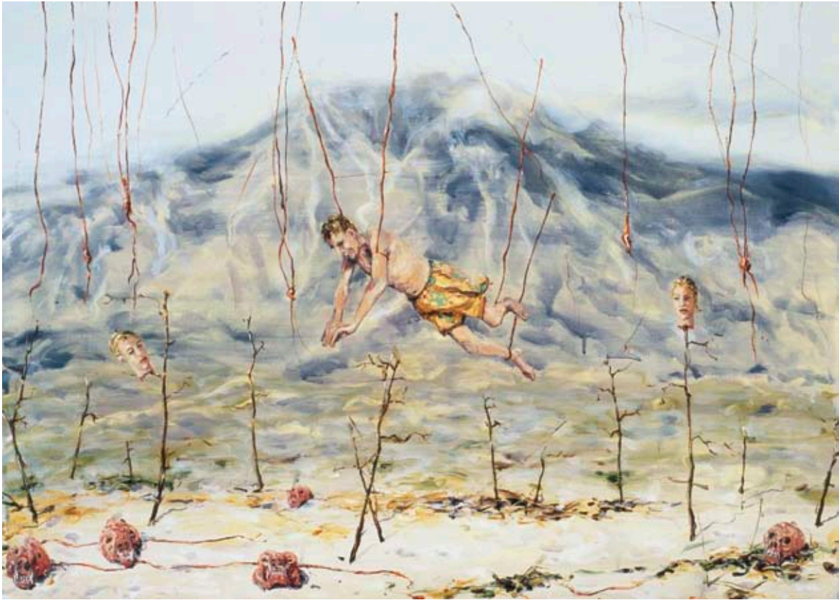
FALLANDE ÄNGEL | FALLING ANGEL, 2007, 50 X 70 CM