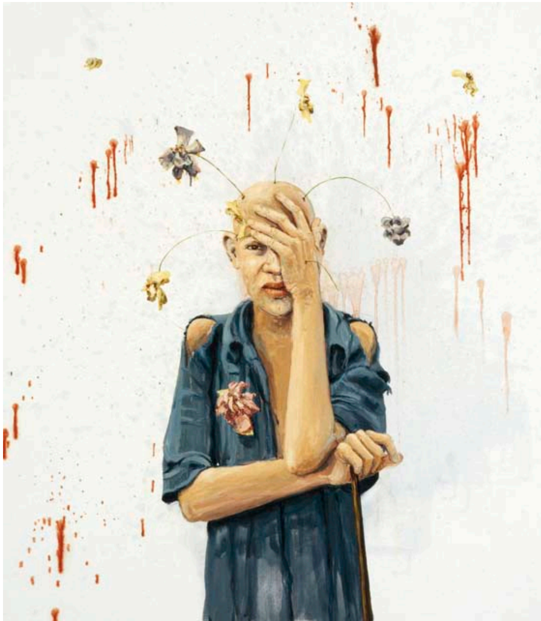
BLOMSTERUTVÄXTER | FLOWER OUTGROWTHS, 2008, 120 × 105 CM