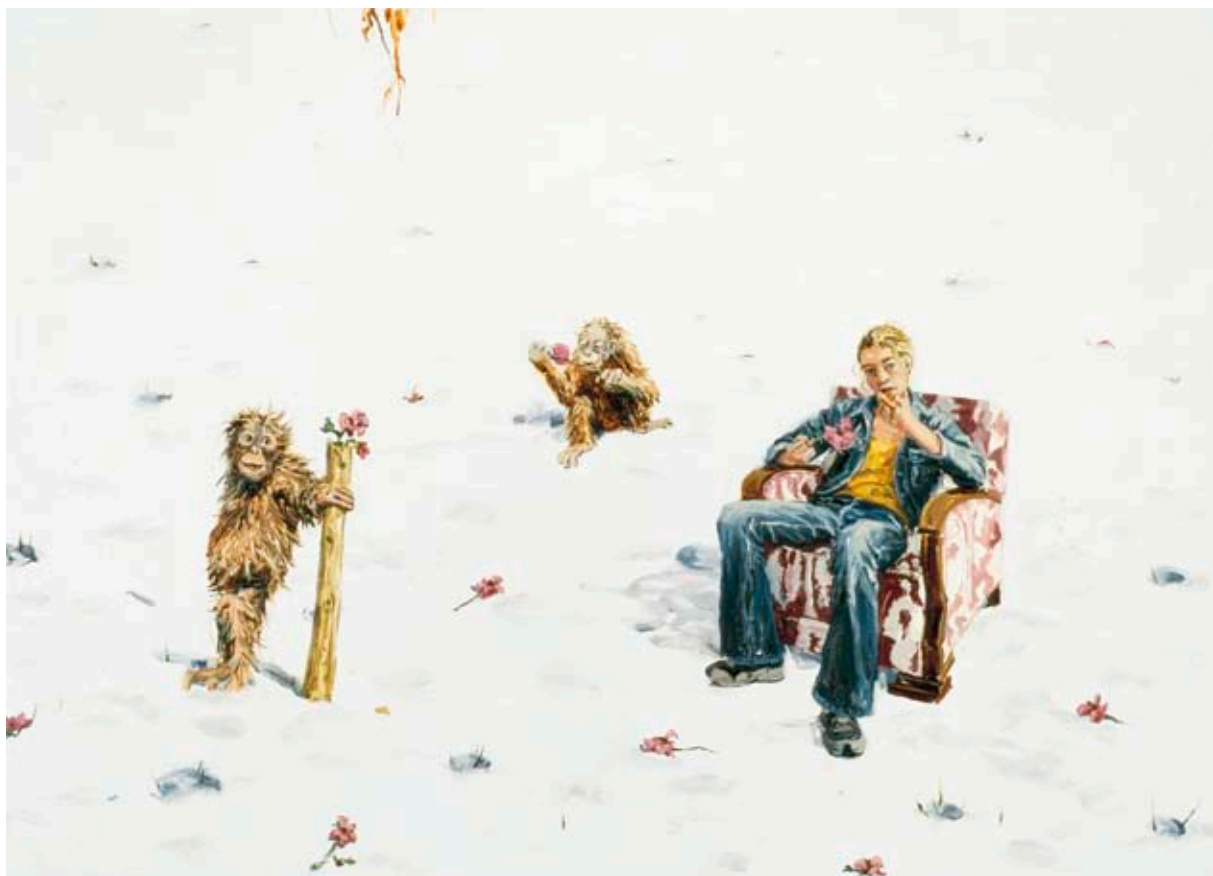
PÅMINNELSESNÖREN | STRINGS OF REMINISCENCE, 2007, 50 × 70 CM