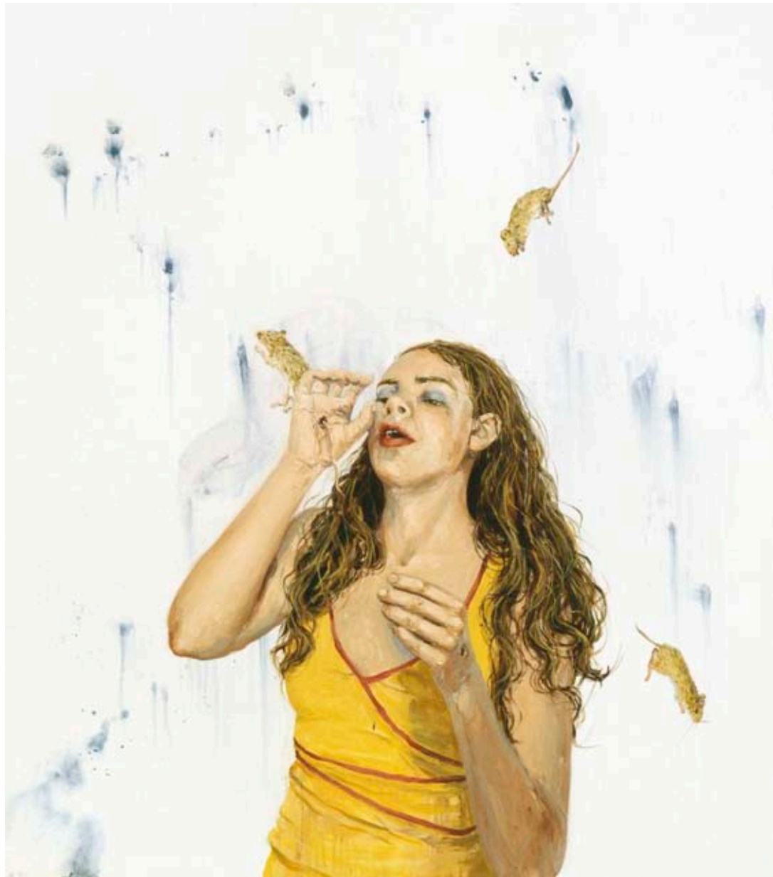
RÅTTOR SKAPAR FLICKJESUS | RATS CREATING GIRL JESUS, 2008, 120 × 105 CM