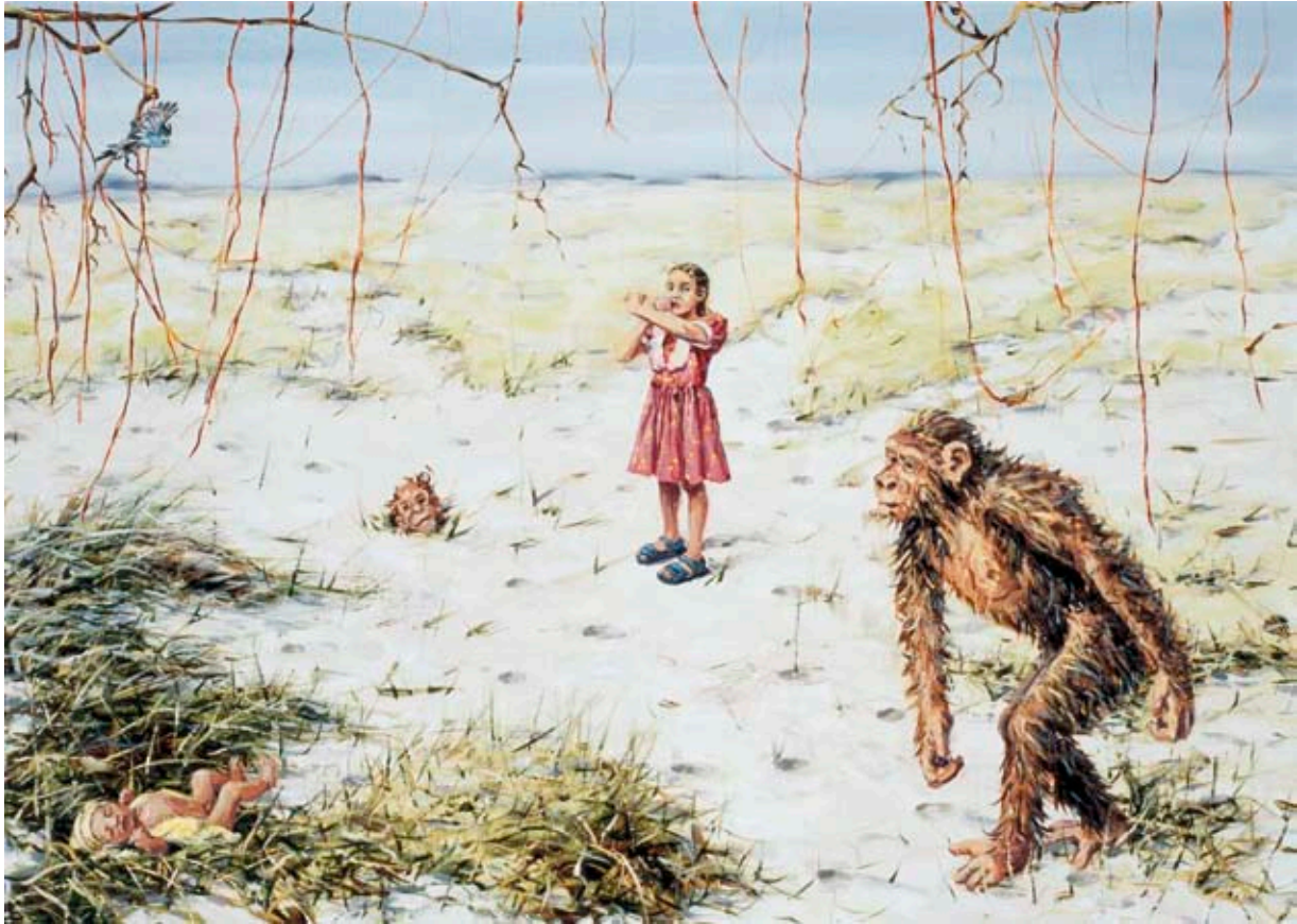
FLICKA GÖR KORSTECKNET | GIRL MAKING CROSS SIGN, 2007, 50 X 70 CM