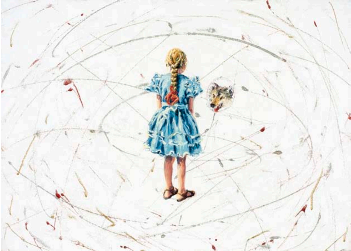
VARGSPEGLING | WOLF REFLECTION, 2007, 50 X 70 CM