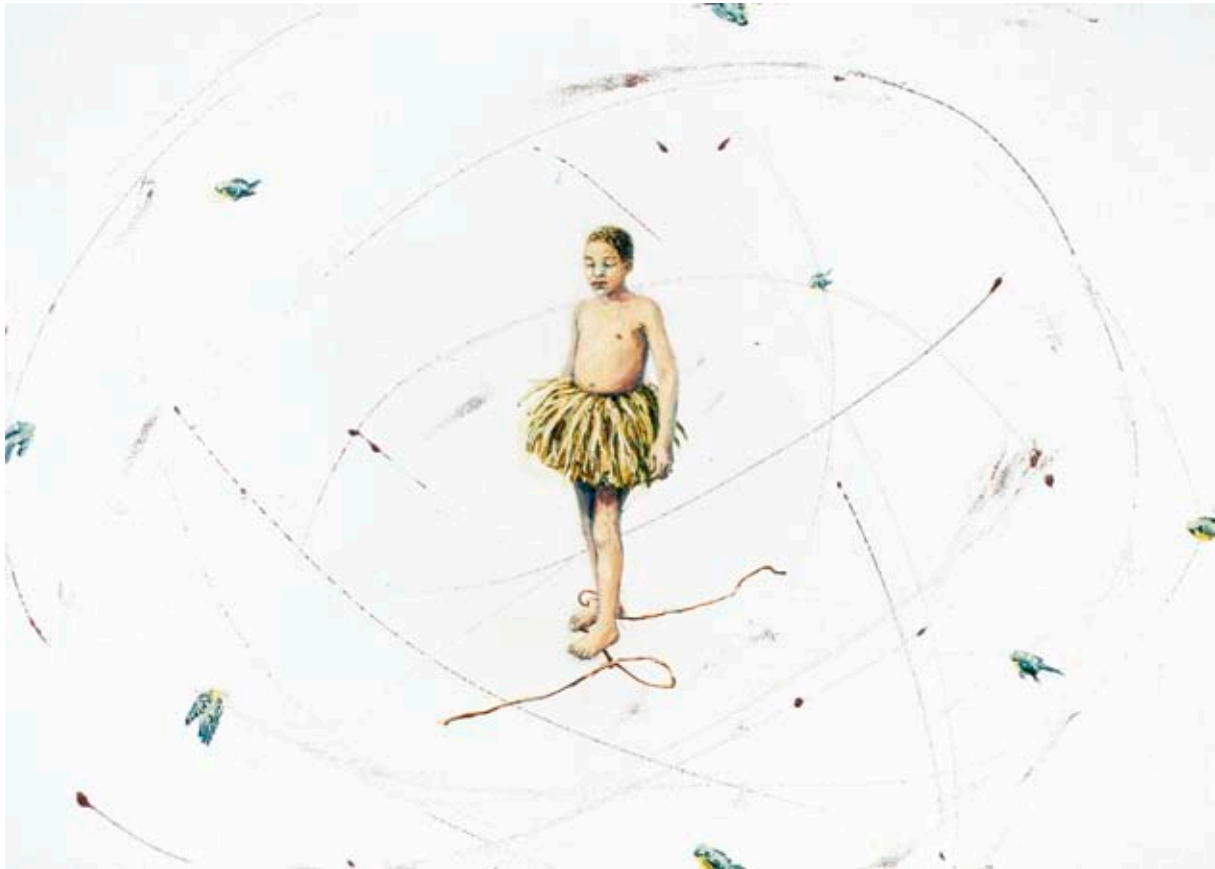
BALLERINA PÅ LIVSSNÖRE | BALLERINA ON STRING OF LIFE, 2007, 50 × 70 CM