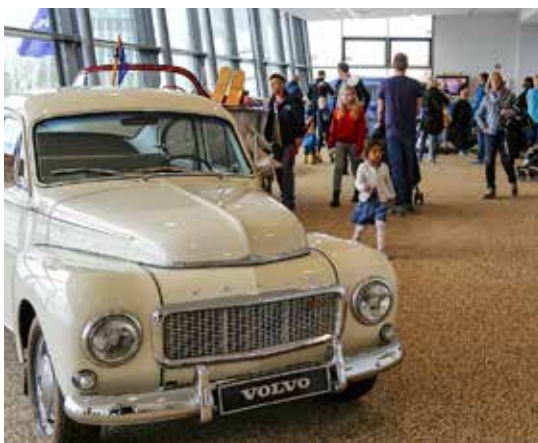
På museet visas många av Volvos modeller från 20-talet till dags dato. PV:n är nog den som "känns mest Volvo".