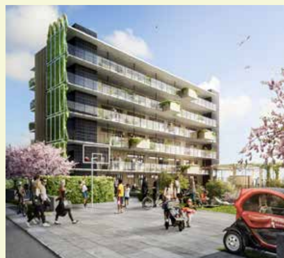
Del av fastigheten sedd från Dr Allards gata.

Göteborg anvisade mark till Riksbyggen för det planerade bygget nedanför Dr Allards gata på Guldheden, i den branta slutningen ner mot Mossens grönområde, med utsikt över Chalmers Studenthem på