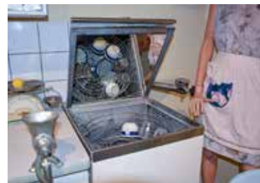
På museet kan man bland annat se hur Husqvarnas första diskmaskin såg ut.