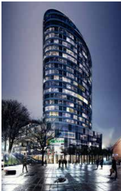
Plans have been made for a 23-storey building close to the Chalmers entrance.

be used for student accommodation. Five floors will be dedicated to Chalmers guest researchers and five to short-term Chalmers-related visitors.