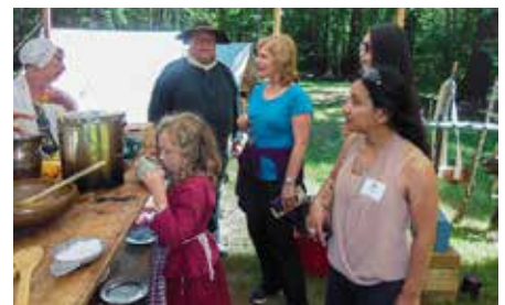
Gruppen gjorde också ett besök i Guilford Courthouse-parken, ett minne från kolonialkriget på 1700-talet.