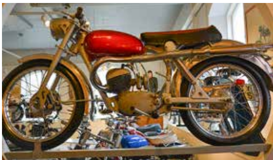
Där fanns också denna Silverpilen, modell 282 E, årgång 1959, med en motor på 175 cc och treväxlad låda.