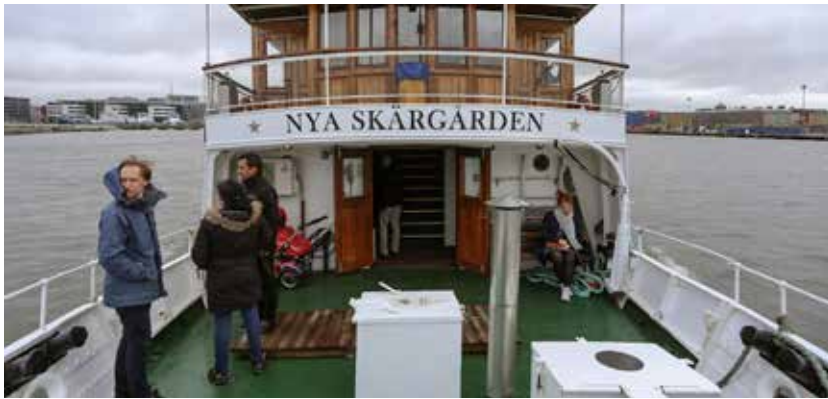
För båten Nya Skärgården var detta premiärturen med passagerare i nya hemmahamnen Göteborg. Båten, som byggdes 1915 och därmed firar 100 år i år, har tidigare trafikerat Vättern.