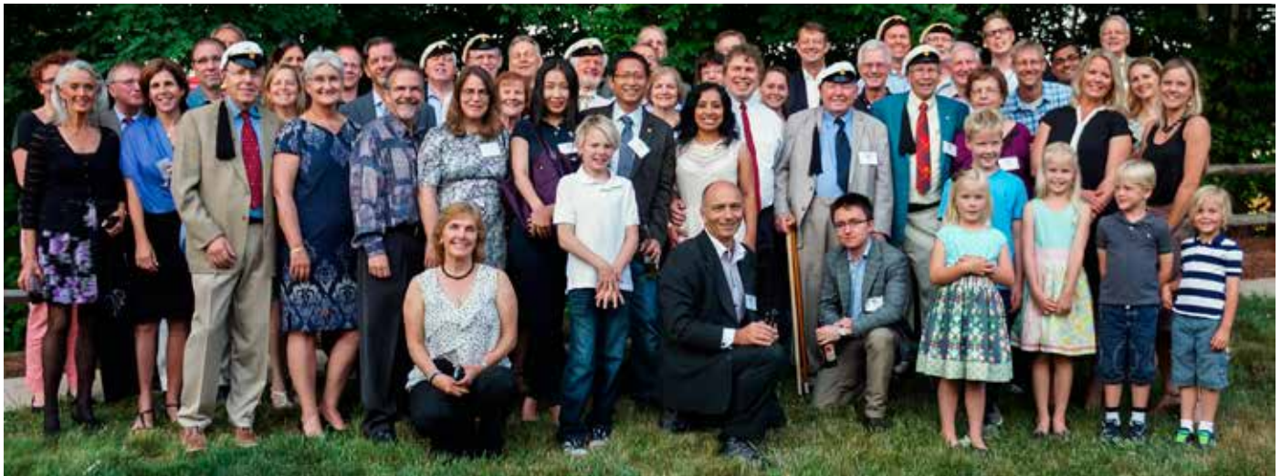
Den glada gruppen radar upp sej i naturen, just innan vår Gasque på Lake Jeanette Swim & Tennis Club i Greensboro. Extra trevligt att det kom flera familjer, och barnen hade jättekul i deras eget lilla jippo med barnvakt in ett angränsande rum.