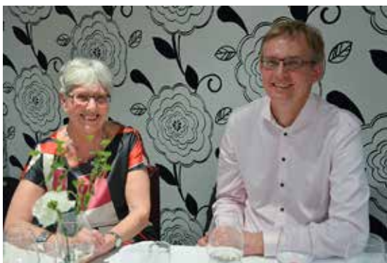
Glada festdeltagare från dagens avslutande värnöte och dito kalas.

då blir det studiebesök till Torsviksverket och sedan blir det spexet Viktoria med efterföljande spexkalas.