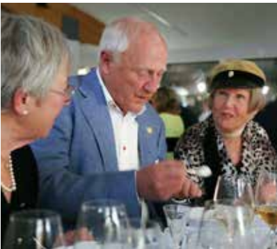
På middagen imponerade gulnade mössor.