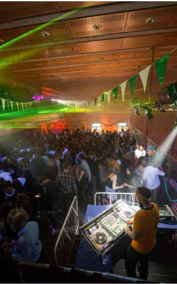
Disco med DJ och lasershow i Kårhuset på ett av Valborgskalasen.