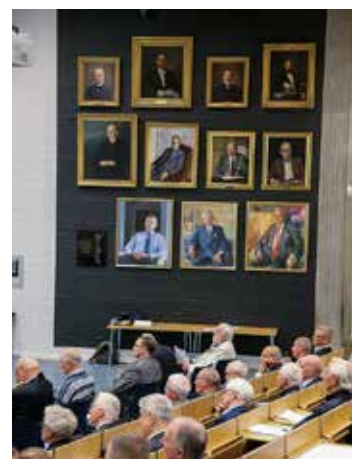
Årsmötet avhölls i Palmstedtsalen där samtliga chalmersrektor blickade ner från sina porträtt.