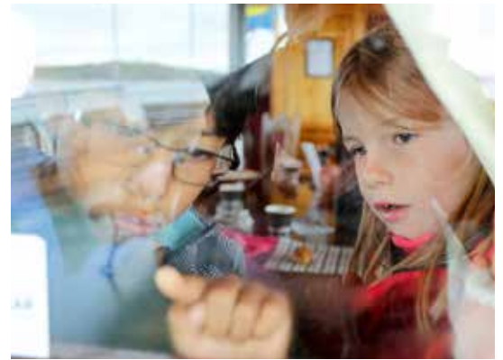
Både yngre och äldre deltagare gillade att åka på guidad tur i Göteborgs hamn och fram till Volvomuseet.