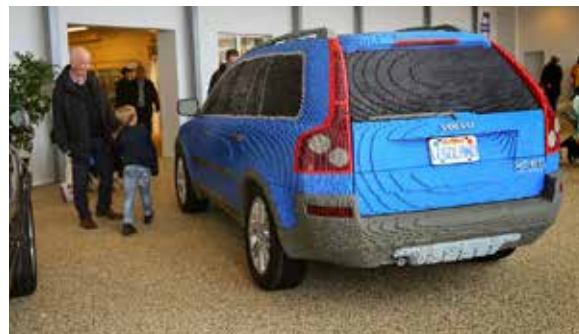
Barnens klara favoritbil var en Volvo XC90 som byggts med 210 076 legobitar. Ett imponerande bygge! Många barnafingrar var där och kände – men bitarna satt fast.