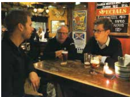
Ses vi på nästa after work i på Akkurat, Hornsgatan 18 i Stockholm? Kolla tider på hemsidan!