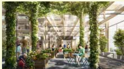
Orangeriet. Stort och klimatanpassat, bokningsbart för större fester eller mindre aktiviteter. Spela boule, laga mat eller bara koppla av i grönskan.

Johanneberg. Dagens tillträde till Campus sker huvudsakligen via Aschebergsgatan med bussar, spårvagn eller bil. Nuvarande system klarar dagens 12 000 personer men ska ytterligare 4 000 arbetstillfällen tillkomma måste tillgänglighet via Gibraltargatan och Eklandagatan utvecklas. Planer, både konkreta och visionära, finns helt klart och ett första dynamiskt steg tas när Johannebergs Science Park tar Chalmersfastigheters superintressanta fastighet i besittning i augusti 2015. LRN