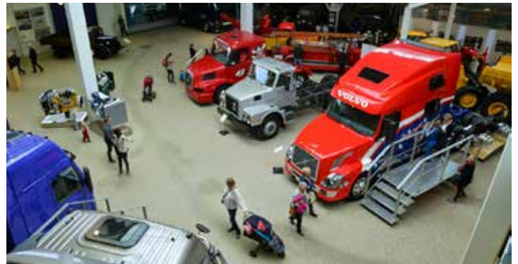
I lastbilshallen kunde man inte bara beskåda olika modeller utan även kliva in i de verkligt stora giganterna där man både har sovaavdelning, kök, toa och tv.