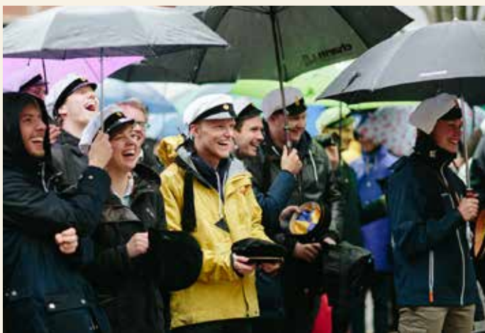
Talen, musiken och underhållningen gjorde att inte ens ett lättare regn kunde kyla ner det goda humöret när den vita mössan sattes på.