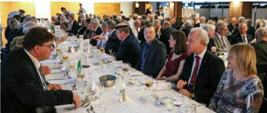
Utsökt trerättersmiddag i Kårhusets stora sal för över 200 sittande gäster. Här fanns en spännvidd i examensår mellan 1945 och 2014 – 69 år!