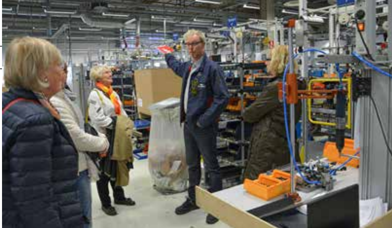
På guidad rundtur i sammansättningsfabriken.

Höstmötet blir den 24 oktober i Jönköping och