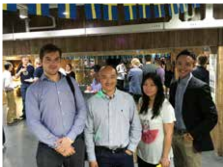
Some of the Swedish food and beer lovers in Shanghai.