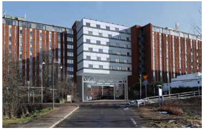
De ursprungliga två "studentbostadshöghusen" vid Gibraltargatan 82 byggs samman via ett femvåningshus på pelare som skapar en stor portal/entré in till det ursprungliga studenthemsområdet.

Chalmersentrén. Exakt innehåll är inte slutgiltigt bestämt men tanken är att de tre nedersta våningarna, "aktivitetsplanen", ska rymma kårstyrelse, administration, samtliga kårbolag och kanske några kåröreningar. Vidare är det tänkt för verksamheter av typ café, gym, butiker med mera.