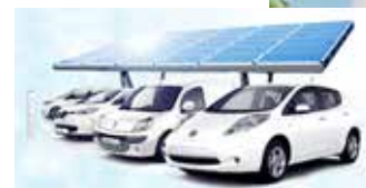
Till studenthemmet hör en elbilspool som hyresgästerna kan använda.

Så säger Joakim Wallin, V93, stolt vd för Chalmers Studentbostäder. Merparten av lägenheterna är av typen ett rum och