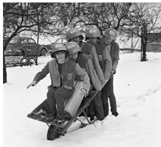
... och så här såg motsvarande gäng ut i 1970 års upplaga av FestU.