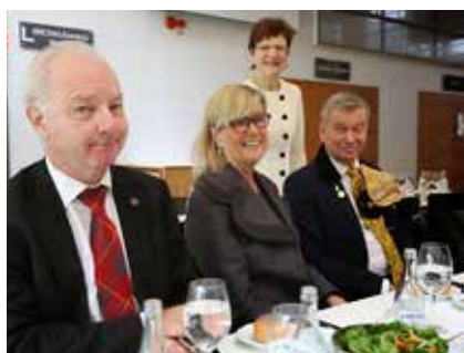
Fyra nöjda deltagare på Chalmers bjudlunch.