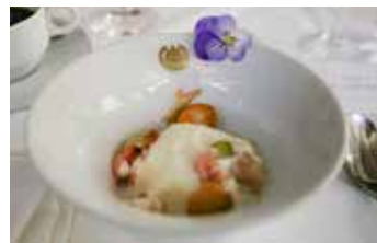
Maten serverades på Chalmers finaste servis med monogram. Här den delikata desserten