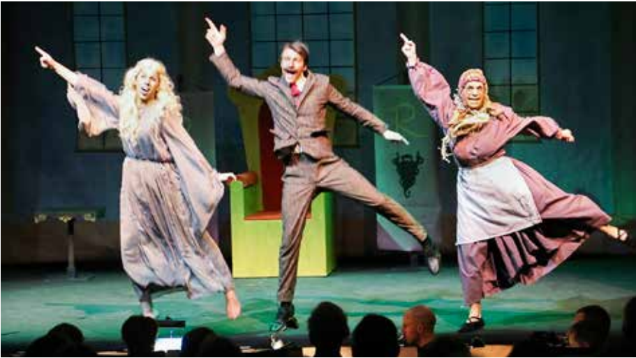
Årets spex Rasputin avnjöts på eftermiddagen. "Ryssland 1905. Grigori Rasputin frilansande bedragare och mystiker med räv bakom örat" stod att läsa i programmet. Måste ses för att förstås!