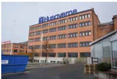
Ingen kan ta miste på vad som finns i denna byggnad.