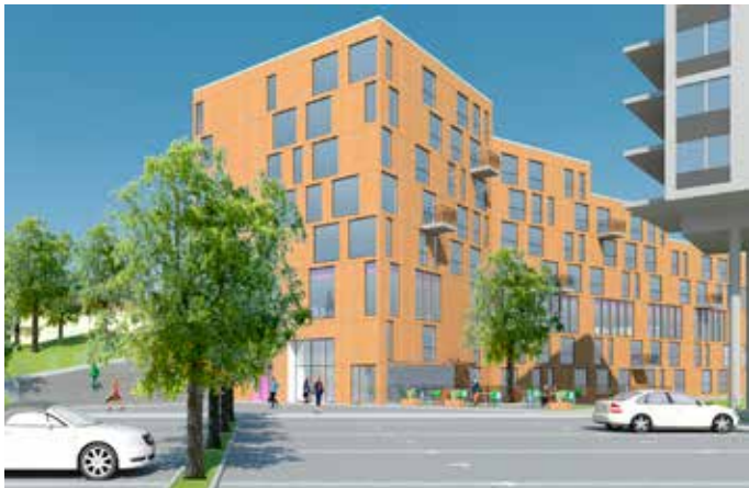
På den branta sluttningen bakom nuvarande studenthemmet vid Gibraltargatan ska, med byggstart 2017, 100 studentlägenheter byggas.