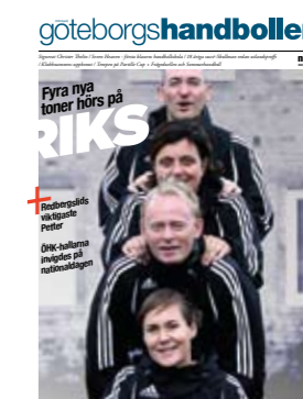
NOSTALGIOMSLAGET. | 3-2008 Fyra nya toner hörs på RIKS