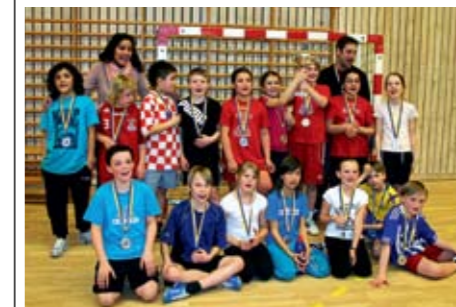
2 | Backaskolan 3A