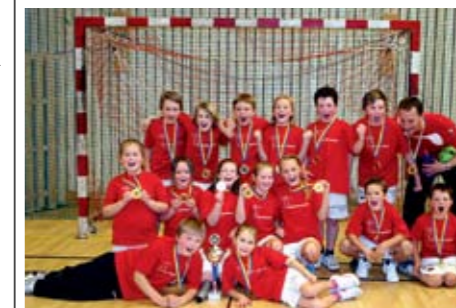
7 | Onsala Montessori

BRONS: FURULUNDS SKOLAN 3 OCH NÖDINGESKOLAN 3S