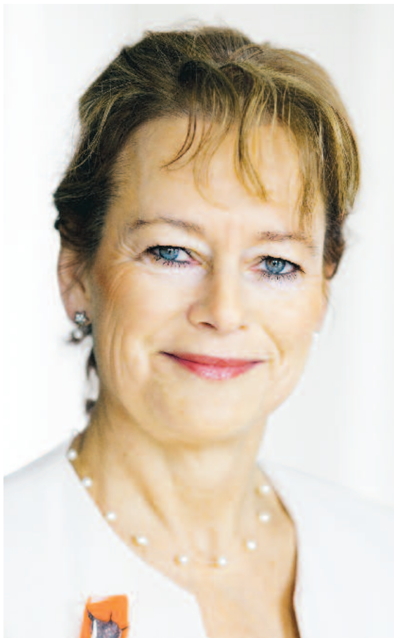
Kulturminister Lena Adelsohn Liljeroth

ntresset är enormt. Enligt kulturministern är detta den mest välbesökta presskonferens som regeringen hållit. Pressrummet på Rosenbad är smockfullt med kulturjournalister och nyhetsreportrar.