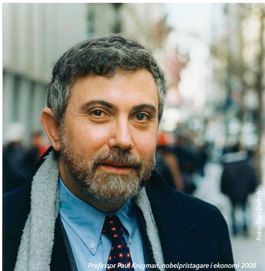
Professor Paul Krugman, nobelpristagare i ekonomi 2008