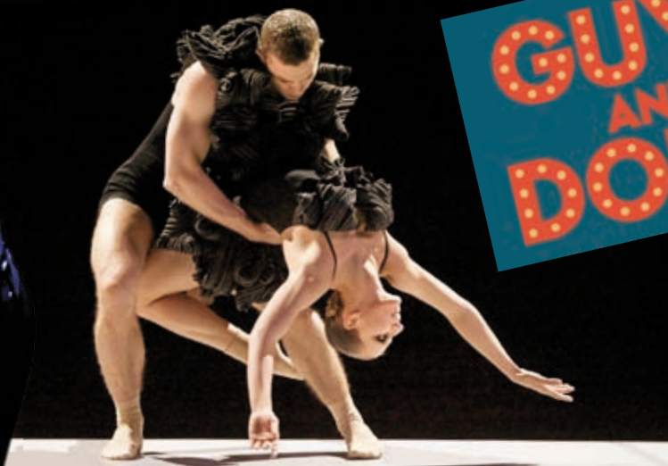
GöteborgsOperans dansare. Foto: Ingmar Jernberg