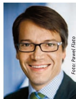
Göran Hägglund (KD)