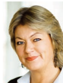
Ylva Johansson (S)