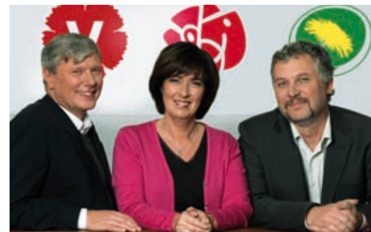
Lars Ohly (V), Mona Sahlin (S) och Peter Eriksson (MP).