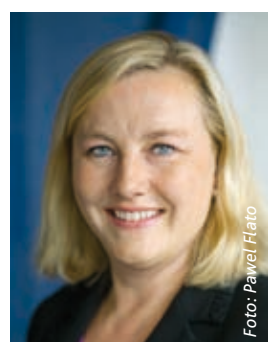
Ewa Björling (M)