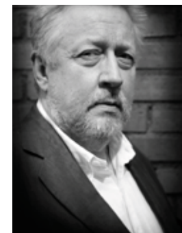
Leif GW Persson