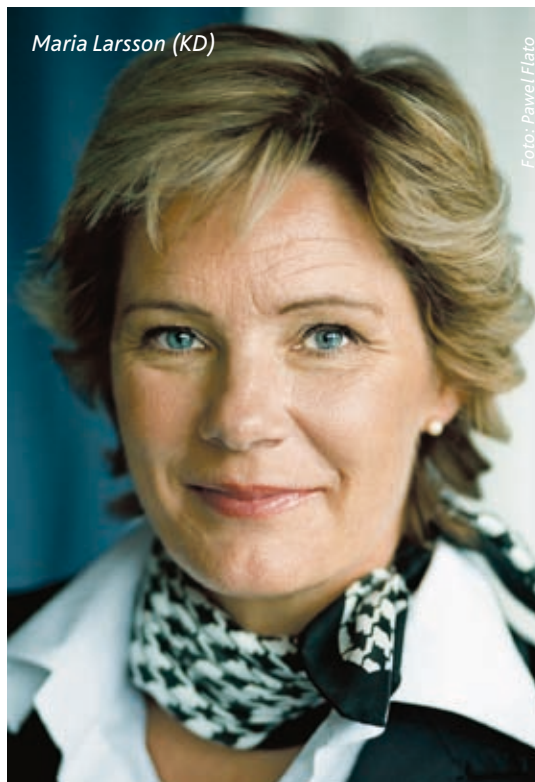
Maria Larsson (KD)