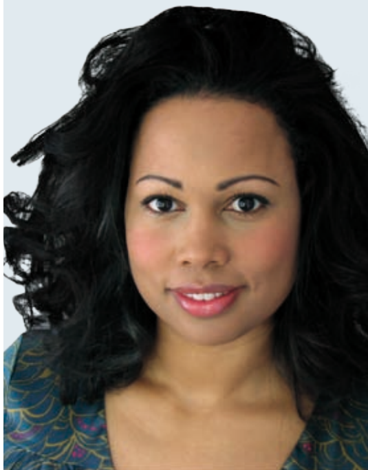
Alice Bah Kuhnke