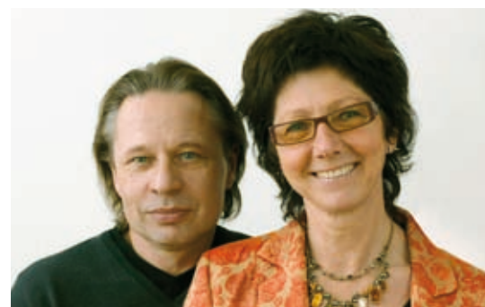
Reine Brynolfsson och Lena Ahlström.