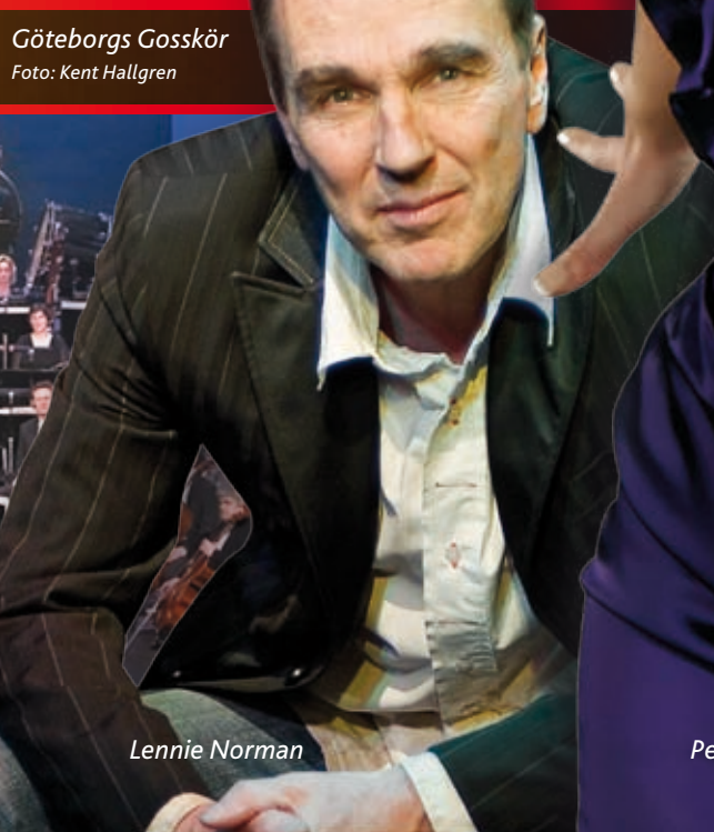
Göteborgs Gosskör