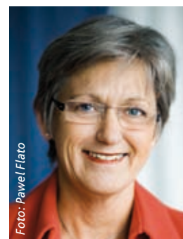
Cristina Husmark Pehrsson (M)